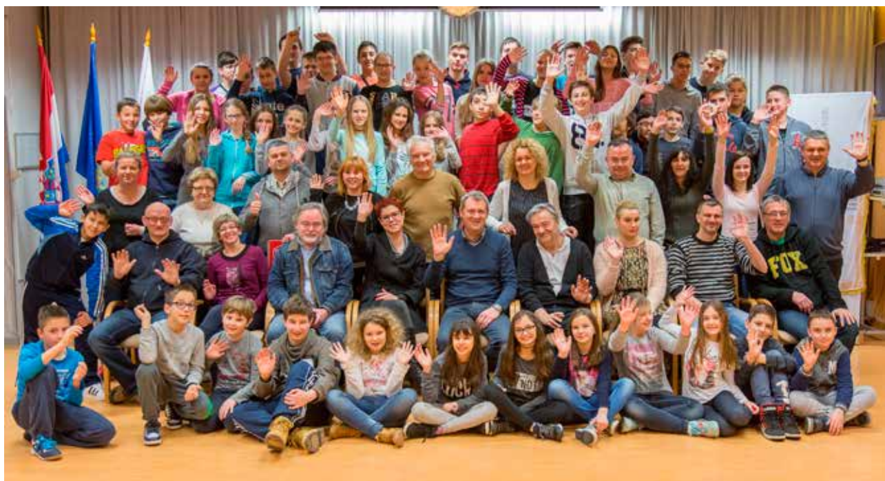
Polaznici i sudionici proljetnih radionica - Proljetna škola tehničkih aktivnosti (HZTK), Robotika za darovite osnovnoškolce (HZTK), Proljetna škola tehničkih aktivnosti - samogradnja solarnih kolektora (HSCB)