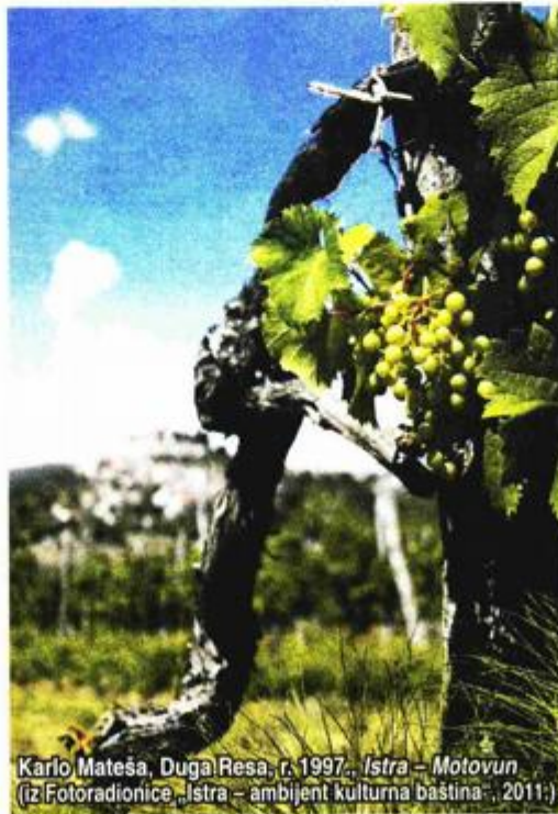
Karlo Mateša, Duga Resa, r. 1997., Istra – Motovun (iz Fotoradionice „Istra – ambijent kulturna baština“, 2011.)

Baštinske fotografije koje stvaraju mladi slika su stvarnosti prelomljena kroz srce, oči i um. Otkrivajući ih javnosti, mladi šire informacije o posebnosti i ljepoti različitih hrvatskih krajeva te stvaraju javnu potrebu da se ta ljepota i posebnost čuvaju i štite